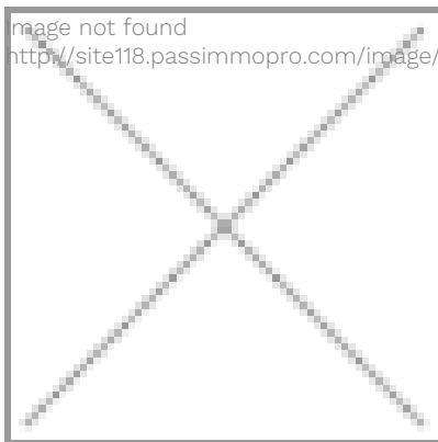
image not found http://site118.passimmopro.com/image/logo-gorron.png